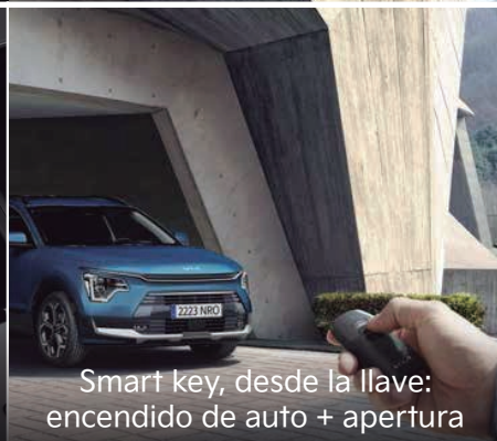
Smart key, desde la llave: encendido de auto + apertura