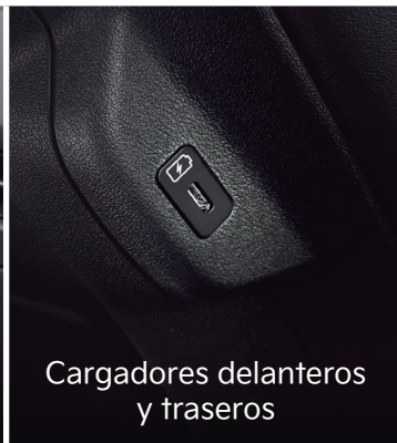
Cargadores delanteros y traseros