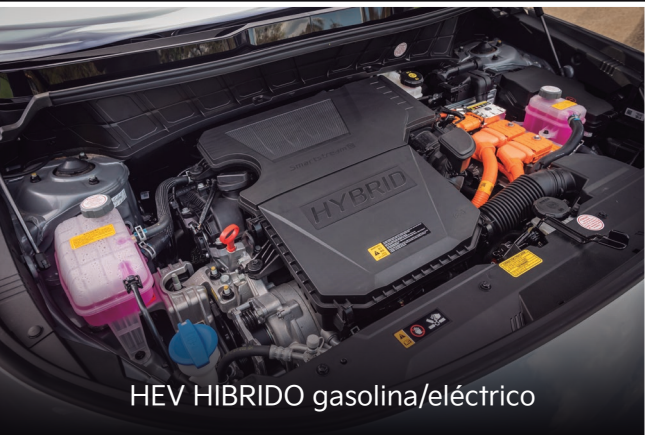
HEV HIBRIDO gasolina/eléctrico