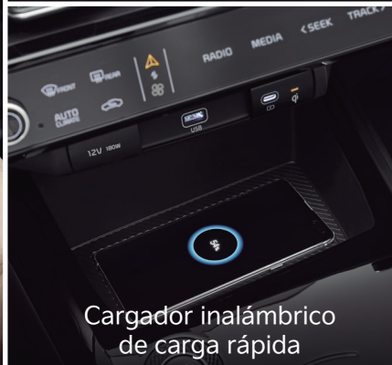
Cargador inalámbrico de carga rápida