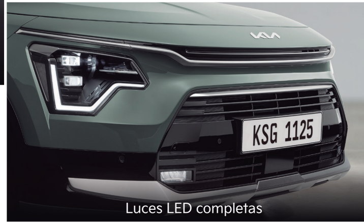
Luces LED completas