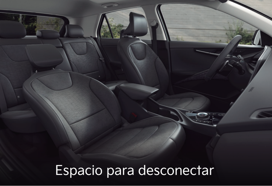
Espacio para desconectar