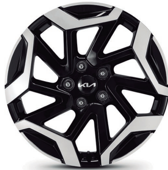
Aros de lujo en aluminio 18" bi-metal