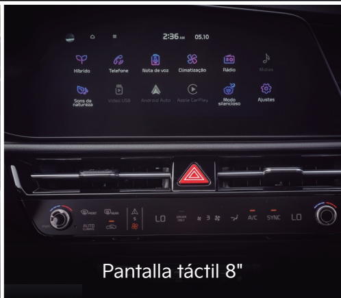
Pantalla táctil 8"