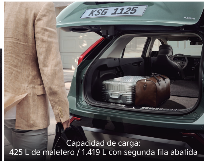
Capacidad de carga: 425 L de maletero / 1.419 L con segunda fila abatida