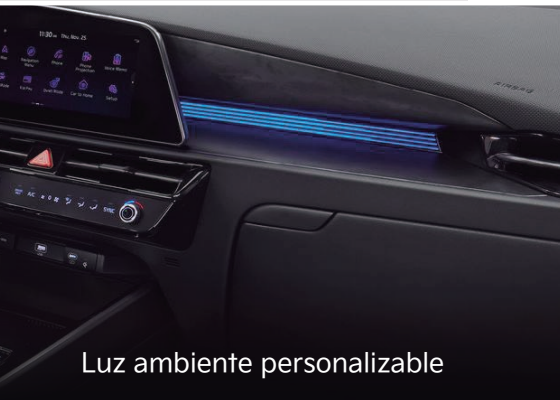
Luz ambiente personalizable