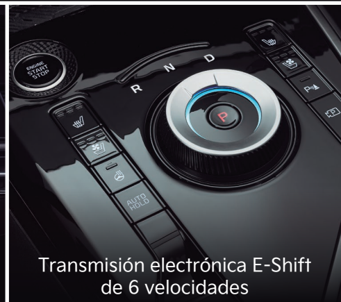
Transmisión electrónica E-Shift de 6 velocidades